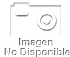
Imagen No Disponible

Descripción: Amortiguador Tapa Bodega Honda CR-V 06-